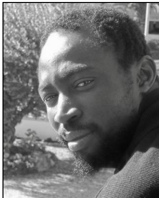
Babou Cham (actor)