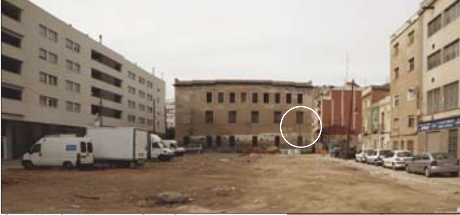
Carrer Mossèn Juliana, entre Oliva i Garcilaso.