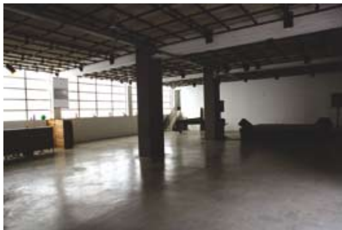
L'espai Andy Warhol

L'espai Andy Warhol , de 300m 2 , és la sala principal de la Nau Ivanow, com a homenatge a l'artista nord-americà. Compta amb la infraestructura tècnica necessària per